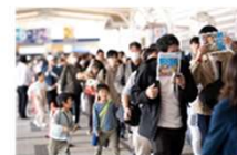
会場ガイド ※2025年は一部デジタル化予定