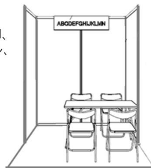
コーナーブースイメージ