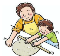
「ラーケーションの日」を利用したいか