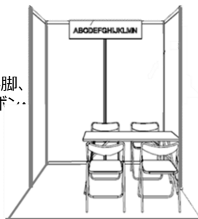
コーナーブースイメージ