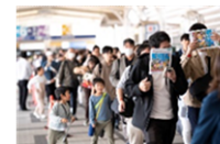
会場ガイド ※2024年は一部デジタル化予定