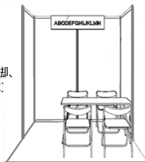
コーナーブースイメージ