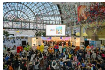
ツーリズムEXPOジャパン2023 グランドフィナーレ