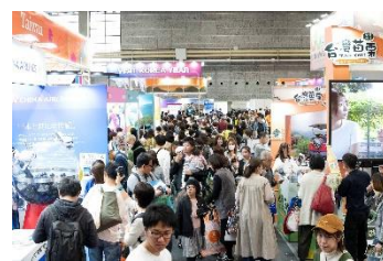
ツーリズムEXPOジャパン2023 場内の様子

長いコロナ禍を経て、観光業界の反転攻勢を象徴するイベントとして開催された2022年。2025年に控える大阪・関西万博で注目を集める「大阪・関西」で開催された2023年に続き、 観光業界の完全復活元年の2024年 は、「旅、それは新たな価値との遭遇」をテーマに、東京ビッグサイトで開催いたします。