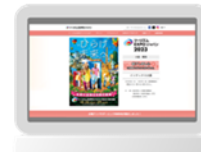
ツリズムEXPOジャパン 公式ウェブサイト (イメージ)