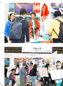
クルーズコーナー2023