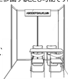
コーナーブースイメージ