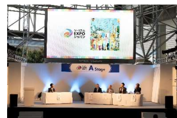
主催者ステージにて業界向け「クルーズセミナー 国際クルーズ再開と今後の展望～ゼロからの復活、そして飛躍～」を実施。

※出展者：クルーズ沖縄 ENJOY! CRUISE OKINAWA、長崎県クルーズ振興協議会、九州7市港湾連携 (下関市、北九州市、福岡市、佐世保市、八代市、別府市、日南市)、クルーズせとうち、フェリーさんふらわあ、大阪港湾局、三重県クルーズ振興連携協議会 / 四日市港客船誘致協議会、横浜市港湾局、岩手県、シルバーシー・クルーズ