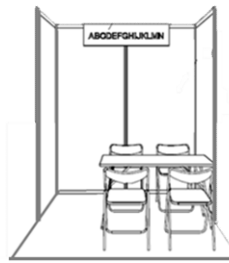
コーナーブースイメージ