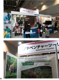
アドベンチャーツーリズムコーナー2023