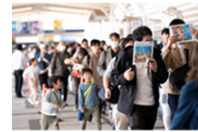
会場ガイド ※2024年は一部デジタル化予定