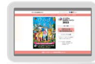
ツーリズムEXPOジャパン 公式ウェブサイト (イメージ)