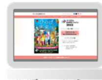
ツリズムEXPOジャパン 公式ウェブサイト (イメージ)