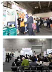
アカデミーコーナー 2023