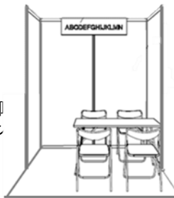
コーナーブースイメージ