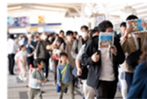
会場ガイド ※2024年は一部デジタル化予定