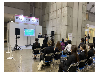
特別コーナー共有ステージにて各出展校・企業がセミナーを開講

神戸大学、流通科学大学 人間社会学部 観光学科、国立大学法人和歌山大学 観光学部、立命館大学ビジネススクール『観光マネジメント専攻』、立命館アジア太平洋大学 サステナビリティ観光学部、流通経済大学 社会学部、国際文化ツリズム学科、立教大学 観光学部、宿泊業への就職相談コーナー、大正大学・追手門学院大学、大阪成蹊大学 国際観光学部、阪南大学国際 学部国際観光学科 (2024年開設)、大阪観光大学