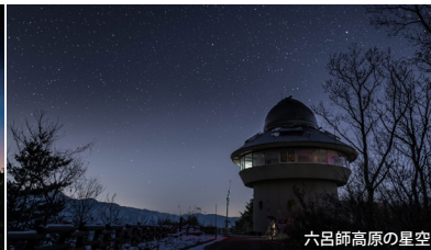
六呂師高原の星空