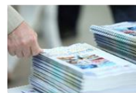
会場ガイド ※2023年は一部デジタル化予定