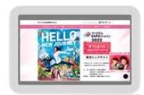
ツーリズムEXPOジャパン 公式ウェブサイト（イメージ）