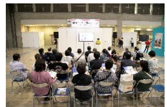
特別コーナー共有ステージにて旅の広場出展者によるプログラムを開講

※出展者：谷町君旅行、フレアツアーズ、Around USA、広島アクティビティ（広島・湯来アドベンチャーズ、ソコイコサイクリングツアー）