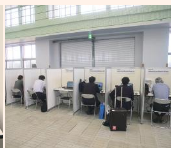
2020年ツーリズム EXPO、オンライン商談会の様子